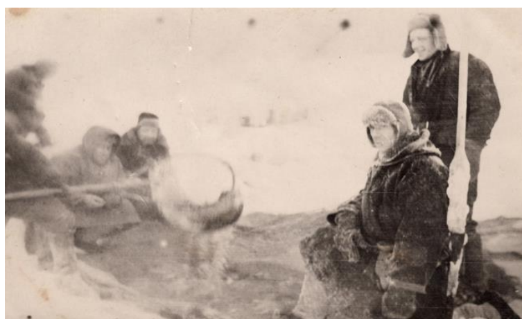
Рис. 9. Сургутские рыбаки

280 000 центнеров рыбы и переработано на рыбоконсервном заводе, эвакуированном из Одессы в 1942 г. (рис. 9). Фотоисточники запечатлели отправку посылок с одеждой, обувью, варежками из западносибирских городов на фронт (рис. 10).