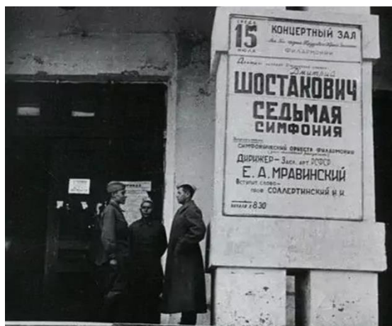
Рис. 15. Солдаты у афиши первого исполнения Седьмой симфонии Д. Д. Шостаковича в Новосибирске Примечание. Фотография из источника [33].

им. С. В. Образцова, Центрального детского театра, ленинградского Государственного театра драмы им. А. С. Пушкина, Ленинградского театра юных зрителей, Белорусского государственного еврейского театра и Академического театра оперы и балета Украинской Советской Социалистической Республики. В распоряжении исследователей имелись многочисленные фотоисточники с фиксацией работы театральных коллективов на новом месте; ракурс съемки выбран таким образом, чтобы показать не только действие на сцене, но и высокую заполненность зала, одухотворенность лиц публики, большое количество офицеров и солдат среди зрителей. Именно на бойцах Красной армии сделан основной акцент фотографий, ведь они были главной надеждой страны в период Великой Отечественной войны (рис. 15).