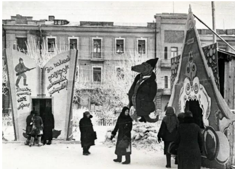
Рис. 16. Зимний городок в Омске Примечание. Фотография из источника [34].

книги присутствуют красноармейцы в зимнем обмундировании (ватной стеганой куртке и теплых штанах, валенках, варежках и шапке-ушанке). «Пощады фашистам нет и не будет!», «За полный разгром немецких захватчиков!» – гласят лозунги со страниц фанерной книги. Вход в снежный городок украшают образы танка и боевого корабля, гордости и опорной силы армии и флота (рис. 16). Фотографии одного из городских скверов представляют ледяную крепость, стены которой выполнены в виде знамен с надписью «За Родину!», многочисленная символика (красные звезды, серп и молот) олицетворяет самобытность советского государства и борьбу за его суверенитет (рис. 17).