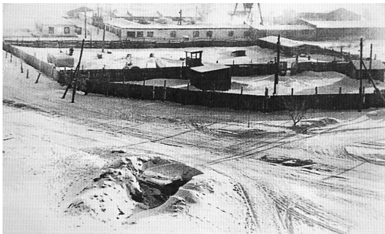
Рис. 1. Завод № 513 в Омске Примечание. Фотография из источника [19].

помещениях, с другой – показывала потребность западносибирских городов в технико-технологическом обновлении.