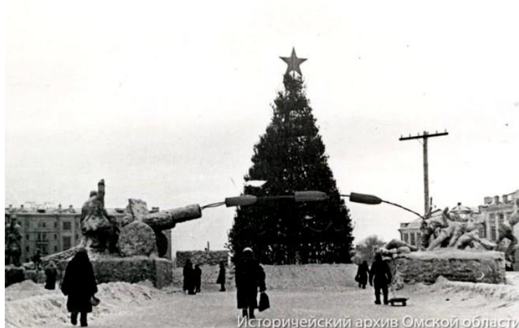
Рис. 18. Первый военный Новый год в Омске Примечание. Фотография из источника [36].

воинов, сказания о которых были заложены еще в Древней Руси и сохранились на протяжении более чем тысячелетнего периода существования государства, а потому приобрели стереотипное восприятие в качестве защитников Отечества. Преемственность культурных традиций дореволюционной России и Советского Союза прослеживалась также в популярных образах сказок А. С. Пушкина: витязя из поэмы «Руслан и Людмила», богатырей, их воеводы и других «воителей смелых, мечом раздвинувших пределы богатых киевских полей» (рис. 19).