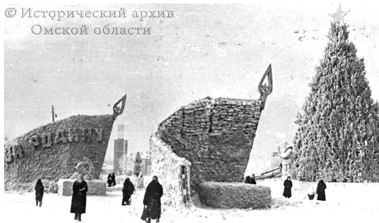
Рис. 17. Первый военный Новый год в Омске Примечание. Фотография из источника [35].