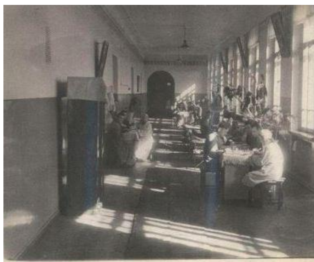
Рис. 13. Эвакуационный госпиталь № 1495 в Омске

лечебные манипуляции и демонстрировавших участливое отношение к подопечным. На фотографии изображены медики, сидящие у кровати неходячих больных, читающие пациентам книги и письма, заботящиеся о повышении комфорта красноармейцев (рис. 13). Вторая линия оптических репрезентаций сосредоточена на эмоциях раненых бойцов: их лица, как правило, не искажены страданиями, а готовы мужественно перенести испытания (рис. 14). Множество фотографий запечатлело момент выписки раненых, что было призвано вселить надежду в восстановление здоровья, повышало престиж медицинских работников и определяло общий позитивный настрой советского общества на победу.