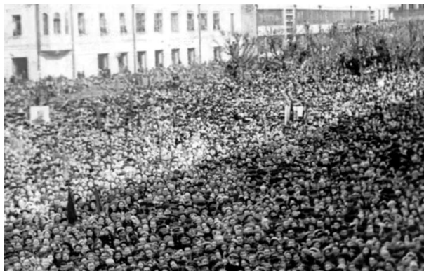
Рис. 21. Митинг 9 мая 1945 г. в Новосибирске Примечание. Фотография из источника [39].