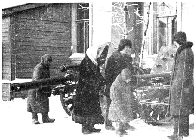
Рис. 12. Трофейные орудия в Омске Примечание. Фотография из источника [30].

Триумф Красной армии в войне не состоялся бы без медиков, вылечивших огромное количество больных и раненых бойцов. Каждый крупный западносибирский город принимал в эвакуационные госпитали нуждавшихся в помощи солдат и офицеров, а также релоцированных из европейской части страны врачей. Красноармейцы, запечатленные на фотографиях, зачастую имели тяжелые травмы и увечья (в случае возможного быстрого восстановления их не направляли бы на лечение в глубокий тыл). На фотоисточниках, посвященных работе военных госпиталей в первой половине 1940-х гг., прослеживаются две линии визуального повествования. Одна из них раскрывает неустанную работу врачей, медицинских сестер и санитарок, производивших