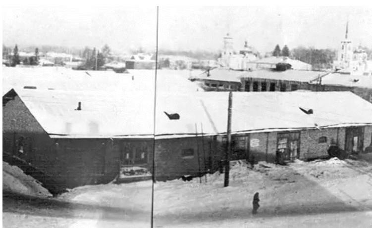
Рис. 2. «Инструментальный» завод в Томске Примечание. Фотография из источника [20].

Общеизвестные образы женщин и подростков, производивших многочасовыми сменами снаряды для фронта, конкретизированы фотографиями Кемеровского механического завода. Ракурс съемки представляет неотапливаемый цех, крупным планом изображено женское лицо, передающее огромную усталость, а ее напряженная поза – физическую тяжесть этого труда (рис. 3). Подростки сфотографированы сзади, чтобы акцентировать внимание зрителей на том, что они еще не выросли до заводских станков и вынуждены ис-