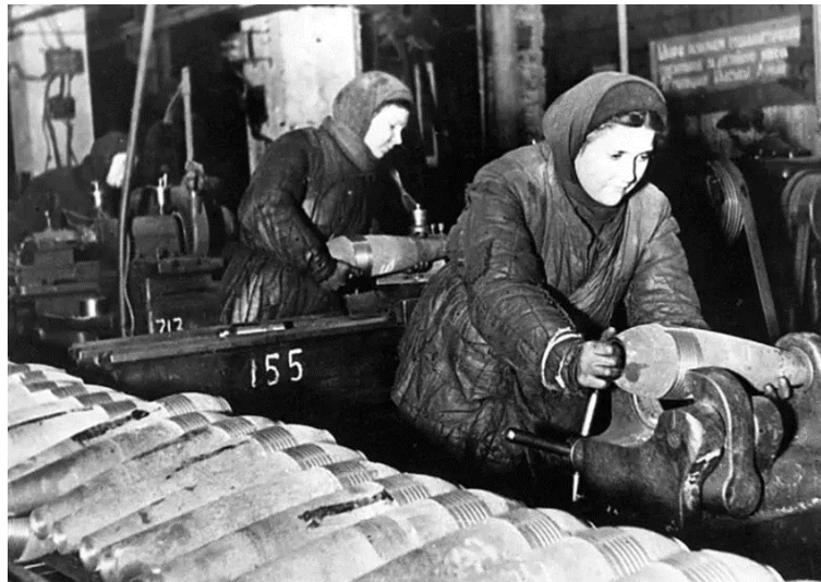
Рис. 3. Кемеровский завод Примечание. Фотография из источника [21].