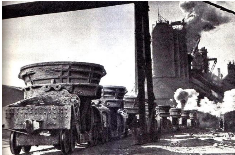
Рис. 8. Подача ковшей к доменным печам Кузнецкого металлургического комбината

броневых автомобилей и другой военной техники. На них изображена подача ковшей к большегрузным доменным печам (рис. 8). Этот производственный процесс стал гордостью комбината, который впервые в мире освоил эту технологию и в сжатые сроки обеспечил Советский Союз необходимым для победы сырьем.