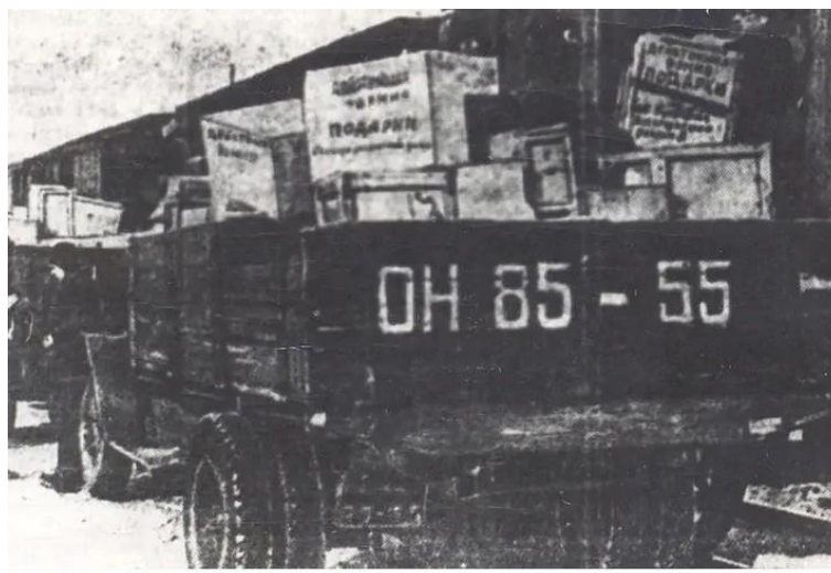
Рис. 10. Загрузка эшелона с подарками из Омска Примечание. Фотографии из источника [28].

Во время Великой Отечественной войны солдатами Красной армии было захвачено большое количество немецкой военной техники. В общесоюзном масштабе ее эксплуатировали для обороны и уничтожения ресурсов противника, изучали для модернизации собственной армии и использовали для обучения стрельбе в качестве мишеней. Но в далеких от фронта городах Западной Сибири была собственная специфика применения трофейной техники. Выставляя на городских улицах немецкие танки, самоходные артиллерийские установки и другие боевые орудия и озвучивая количество захваченной техники противника, советское руководство