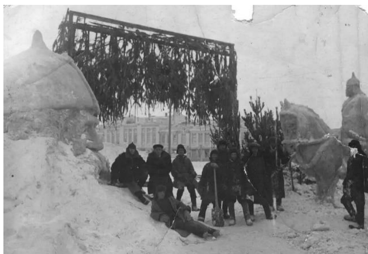
Рис. 19. На площади Дзержинского в Омске Примечание. Фотография из источника [37].

Долгожданная победа стала всенародным праздником: 9 мая 1945 г. Ю. Б. Левитан