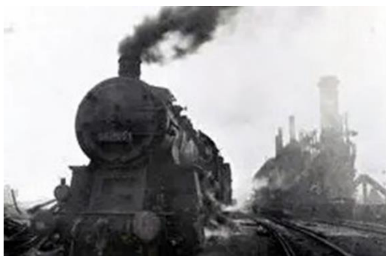
Рис. 11. Трофейный паровоз в Новокузнецке Примечание. Фотография из источника [29].

воспитывало в сибиряках гордость за армию, демонстрировало результаты тылового труда и вдохновляло на дальнейшие производственные подвиги. Анализ фотоисточников позволил утверждать, что перечисленные цели реализовывались на массовом уровне, поскольку трофейная техника размещалась в местах высокой проходимости горожан и вызывала их интерес независимо от пола и возраста (рис. 11, 12). Сибиряки были включены в общесоветский патриотический дискурс, что способствовало сплочению всех народов и социальных групп в государстве и приобщало к единой культурной коммуникации.