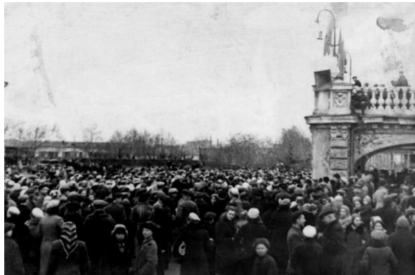
Рис. 20. Митинг 9 мая 1945 г. в Омске Примечание. Фотография из источника [38].

и взволнованности (рис. 20). Участники митингов несли портреты И. В. Сталина и красные знамена – государственные символы Победы. Как и война, так и победа в ней стали важными механизмами сплочения локальной общности сибиряков, осознания ими неразрывной связи с другими частями государства (рис. 21).