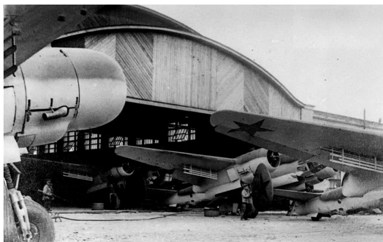
Рис. 6. Бомбардировщики Ту-2 в Омске