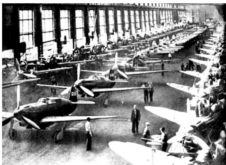
Рис. 7. Конвейер сборки истребителей Як-7 в Новосибирске Примечание. Фотография из источника [25].